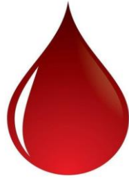
عند استعمال بعض الأدوية مثل الدواء الي يجري الدم