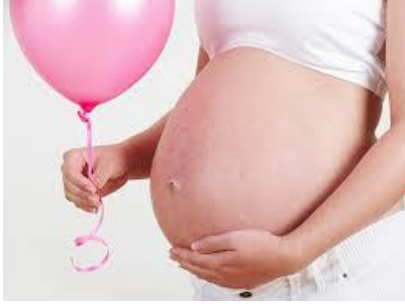
في حالة الحمل