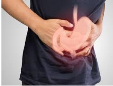
قرح في المعدة