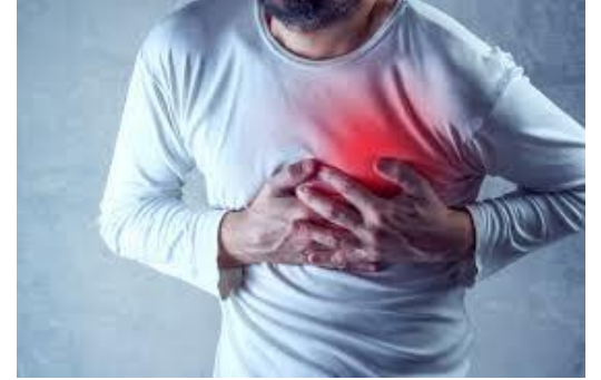
عند وقوع جلطة دماغية/ قلبية